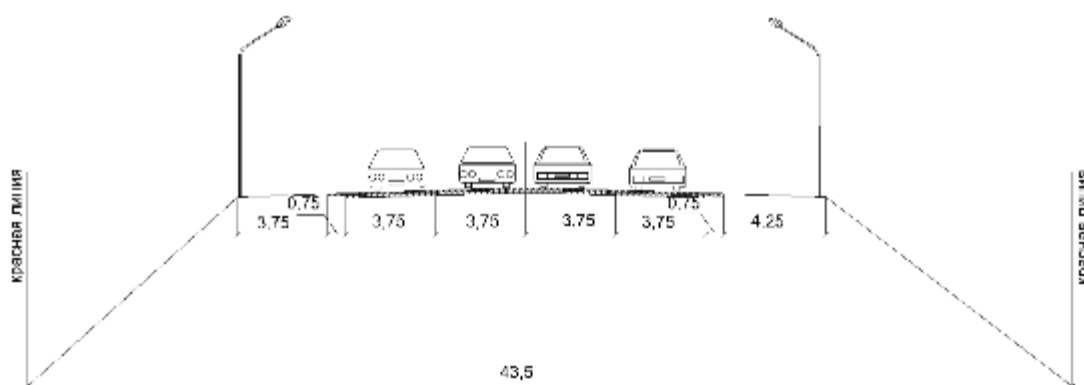
Рисунок 1 Поперечный профиль сечения 1-1